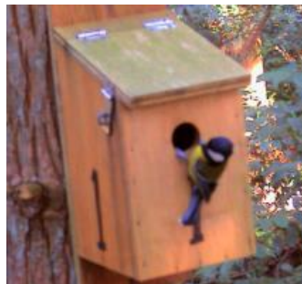
LPN – Liga para a Proteção da Natureza

As aves de que falamos são os chapins, que utilizam cavidades naturais em árvores para nidificarem e que apreciam bastante as caixas ninho;